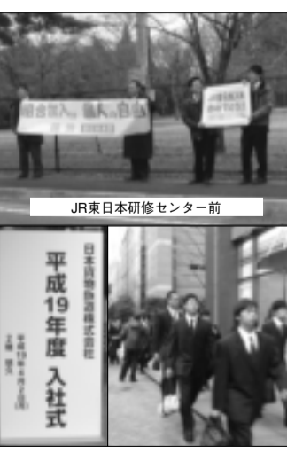
JR東日本研修センター前 平成19年度入社式

四月二日には、J R 貨 物 の 入 社 式 が 水 道 橋・J R 貨 物 本 社 前 の ホ テ ル メ ト ロ ポ リ タ ンで行われた。当日は入社式のオンパレ ードで、J R 関 連 会 社 の 入 社 式 な ど も 催 さ れ るなか、J R 貨 物 会 社 の 新 入 社 員、ピ カ ピ カの一三四人に訴えた。残念ながらこちら は、あいつも変わらず事前に通達してあつた のか、チラシを受け取る人は殆ど居なかつ たが、数名が興味を持って受け取った。