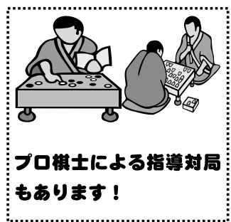
プロ棋士による指導対局もあります!