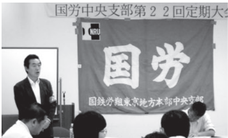
国労中央支部第22回定期大会

討論は一名から発言を受け「試験の差別がまだある。自動昇格など上部へ要請を」「六五才までの定年延長や再雇用制度での実態交流を」「勤務上で問題が多々ある」「再雇用で、あなたの働く所はないと言われた」「技術断層問題」「退職者増に伴う組織拡大の重要性」「P会社の劣悪な労働条件の解消を」「JRC監督委託は労働者派遣法に抵触