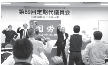
第89回定期代議員会

午後から質疑に入り、経過に対して「新採対策以降、組対ニュースなど具体的な動きがない」と指摘があった。続いて運動方針の討論に入り六名から「出向先では人が少なく一日に何カ所も職場を回さね教育もままならない。安全は掛け声だけで実作業に反映しておらず、国労として運動を作りたい」「昇進試験は和解内容が守られているとは思えない。合格した人にアンケートを取っては」「公共交