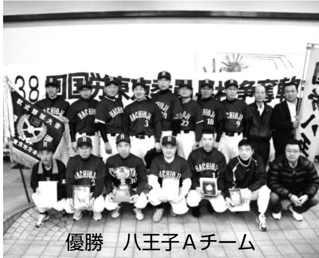
優勝 八王子Aチーム

多くの皆さんにグリーンスタッフの意見・要望を知っていただき、改善に力を貸していただけたよう、さらにはJR東日本会社にも理解していただき、待遇改善の一助になるよう、今回はその一部を紹介していきます。