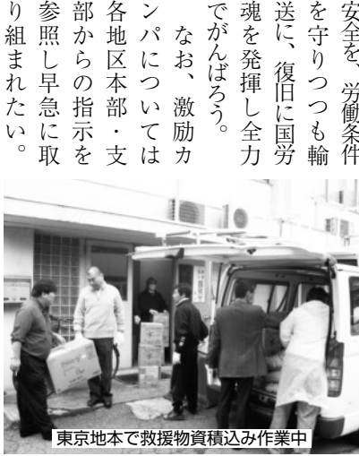
東京地本で救援物資積み込み作業中