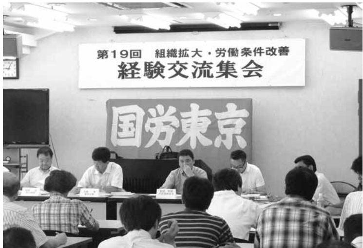
第19回 組織拡大・労働条件改善 経験交流集會