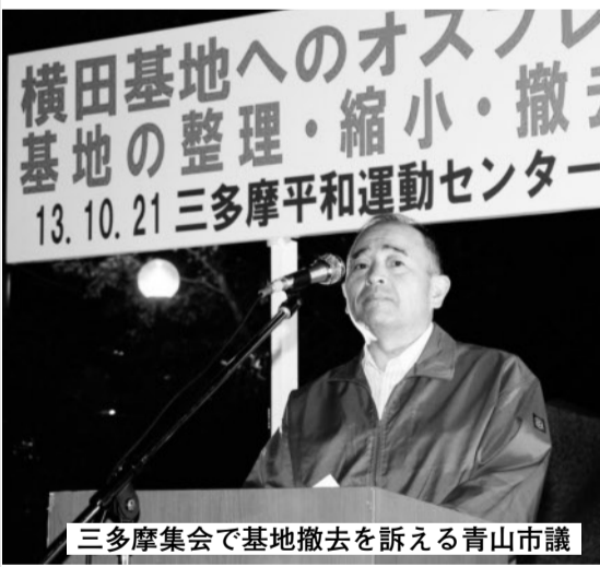
三多摩集会で基地撤去を訴える青山市議