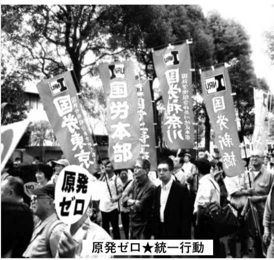
原発ゼロ★統一行動