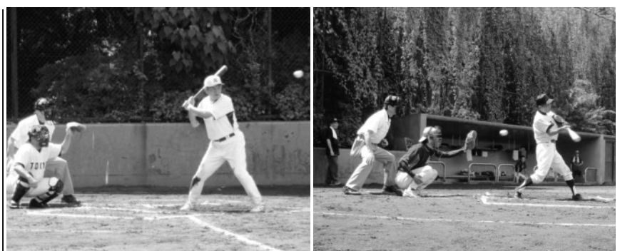
第44回国労東京委員長杯争奪軟式野球大会

ことで、組合員の不安も大きいと訴えていた。駅の構造上車いす対応の警備員を配置している谷保駅では、現在行われているエレベーター設置工事が終了しても、障害者施設が駅付近にある関係で頻繁に乗り降りがある車いす対応のため、警備員を残してほしいと訴えていた。今後も、地方本部は定例で組織対策オルグを実施していくので、協力をお願いする。