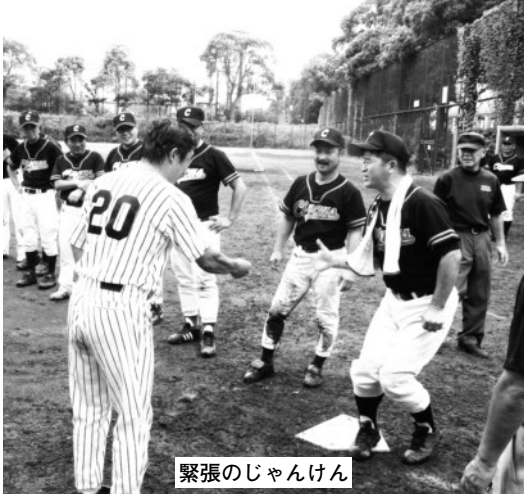
緊張のじゃんけん