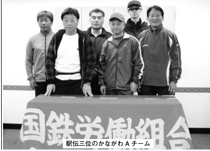
駅伝三位のかながわAチーム