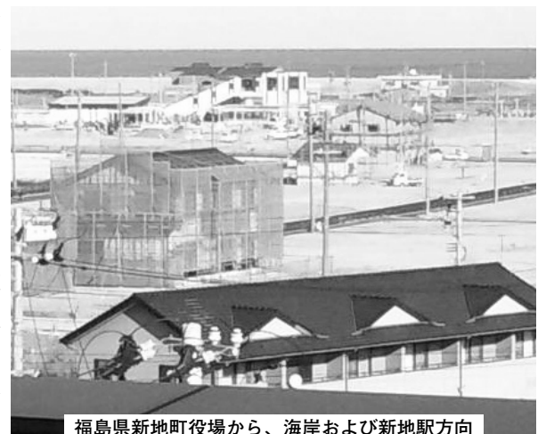
福島県新地町役場から、海岸および新地駅方向