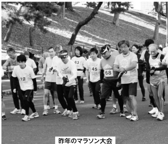
昨年のマラソン大会