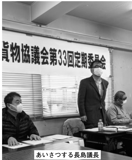
あいさつする長島議長