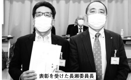
表彰を受けた長瀬委員長