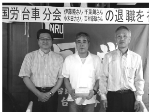
記念撮影するみなさん