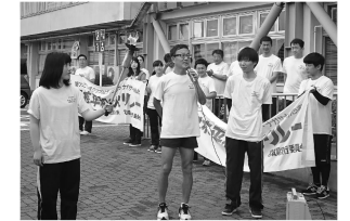
七ヶ浜町の出発集会から

各自治体前では、引継ぎ集会が行われ、各自治体の町長、市長から激励の言葉が述べられるなど、32年の継続が、平和やあらゆる核の廃絶への力になっており、今後も継承していかなければならないと、参加者が思いを新たにしてきました。