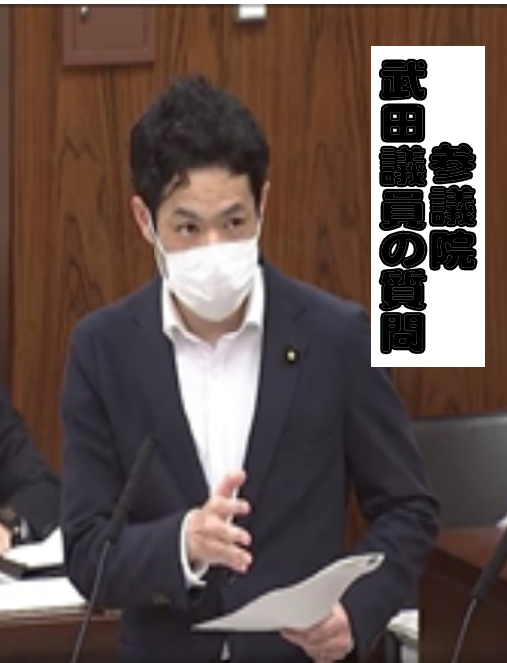
参議院 武田議員の質問

5月も中旬になり、コロナの関係で外出自粛が続いています。「ちよつといっぶく」は栄村へ行けませんので記事が書けません。来月はどうな状況になるのでしょうか。