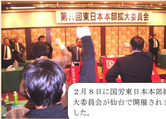
2月8日に国労東日本本部拡大委員会が仙台で開催されました。