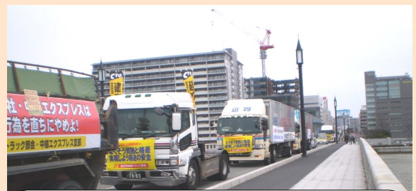
4月21日ダンプトラックパレードが行われました。古町十字路では宣伝行動が展開、JAL争議団をはじめ県内の不当解雇・不当労働行為で闘っている労働組合の仲間の皆さんが訴えました