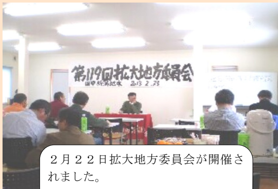
2月22日拡大地方委員会が開催されました。