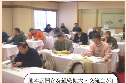
地本旗開き&組織拡大・交流会が1月19~20日湯沢で開催されました。大宮の方々と交流を深めました。