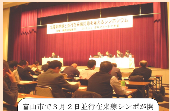
富山市で3月2日並行在来線シンポが開催されました。この日は、大荒れの天候で、富山駅までかなりの時間がかかりました。大変な一日でした。