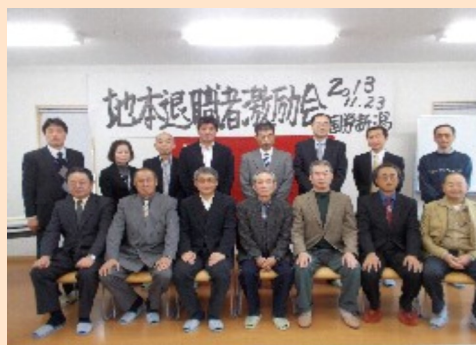
11月23日地本退職者激励会が開催されました。2013年1年間をふいかえって、いろいろありましたので、全部は載せられませんでした。あなたにとって2013年はどうでしたか?そして2014年はどんな年にしたいでしょうか?2014年も「国鉄新潟」をお願いします