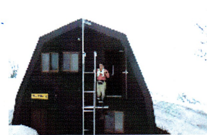
白山の避難小屋まえ(この写真昨年3月27日)